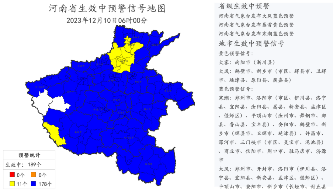
图3 2023年12月10日6时河南省生效中的预警信号

天气防范工作的通知》；省气象局召开新闻通报会；省气象灾害防御及人工影响天气指挥部组织公安、交通、应急、住建、电力等部门联合会商。9日，省低温雨雪冰冻灾害应急指挥部和省气象灾害防御及人工影响天气指挥部联合下发《关于做好近期低温雨雪冰冻灾害防范应对工作的通知》；省气象局发布大风、寒潮、暴雪预警，启动重大气象灾害大风Ⅳ级，寒潮、暴雪Ⅲ级应急响应；省气防指启动重大气象灾害大风Ⅳ级应急响应。截至目前，全省共发布大风、寒潮、大雾、暴雪等预警信号198条，生效中的有189条。各地各部门需继续密切关注属地气象台站发布的最新天气预报、气象灾害预警信号和气象风险提示。