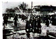
反动军警镇压北平爱国学生