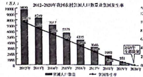
道德与法治试卷 (B) 第 1 页 (共 4 页)